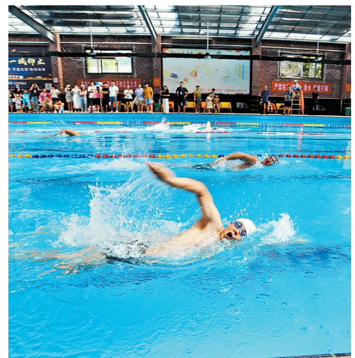
7月16日，由商州区老体协游泳专委会主办的游泳竞赛活动在市泳乐健身游泳馆举行，100多人参加活动。

镇安中学相关负责同志说，镇安中学非常重视德育教育，希望通过优秀的爱国题材电影，激发学生们的爱国主义热情，增强他们努力学习和锤炼本领的动力，提升他们的自豪感和自信心。开展公益电影进校园活动，不仅丰富了校园文化生活，营造了健康活泼、积极向上的校园文化氛围，还发挥了电影在学校中的宣传服务优势，促进基层文化共建共享，提升文化惠民的服务效能，增强人们的文化获得感、幸福感。