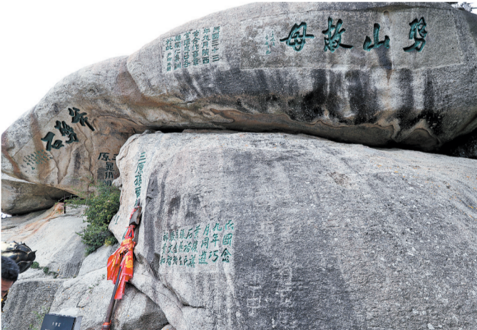
沉香劈山救母斧劈石