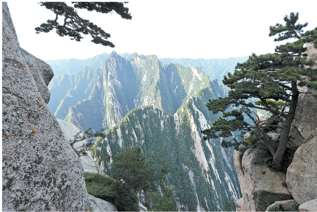
从南峰孝子峰看华山

本次聚焦华山，不仅让我们从华山的奇险雄伟中记录了祖国山河的壮丽，而且从古诗、诗词、书法、传说中感受到了华夏文化的厚重和辉煌。华山不愧为“奇险天下第一山”！