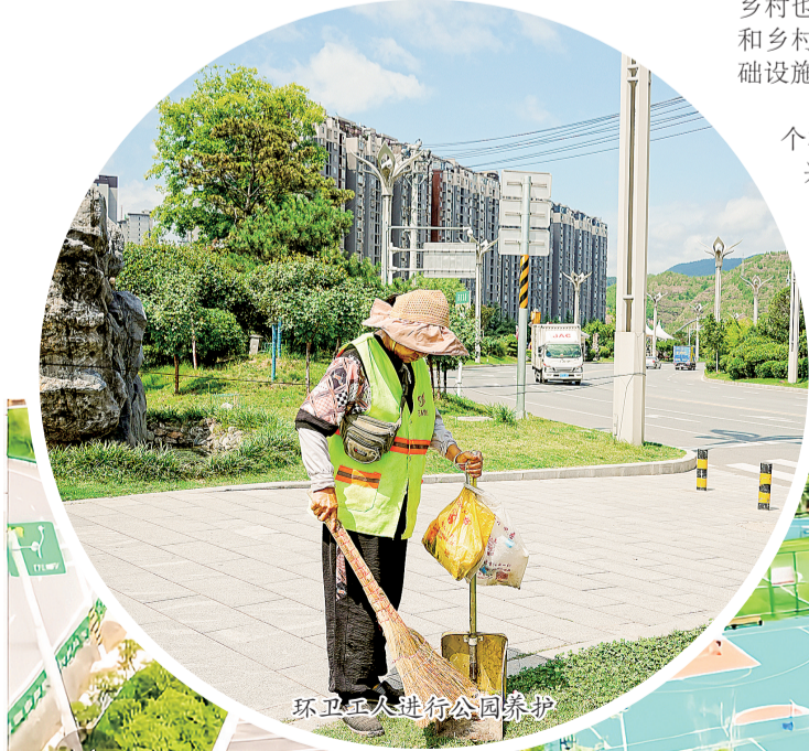
环卫工人进行公园养护