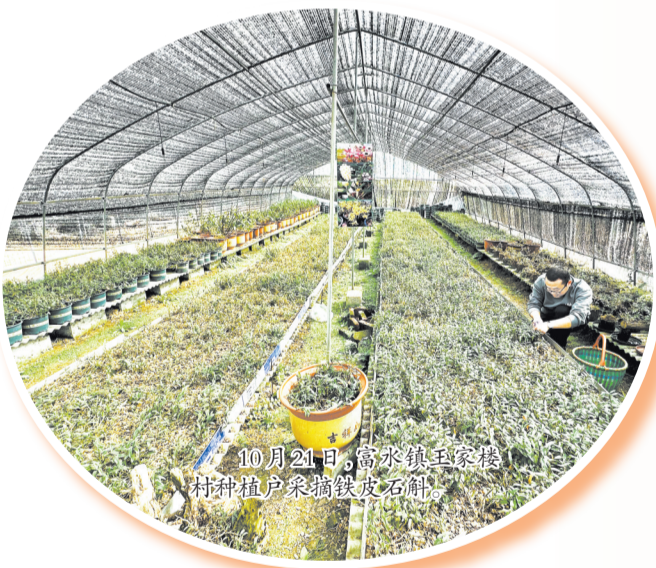
10月21日，富水镇王家楼村种植户采摘铁皮石斛。