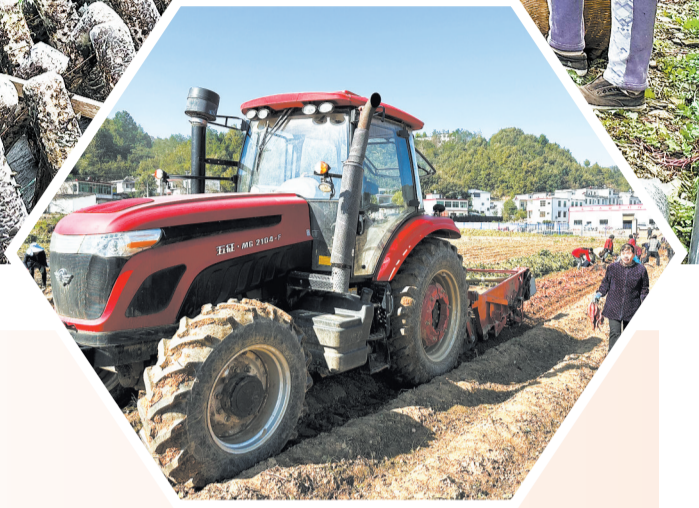
10月22日，过风楼镇太平庄村的村民在挖蜜薯。