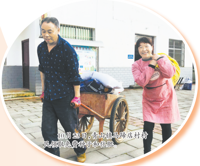
10月23日，青山镇马蹄店村村民领取免费种子和化肥。

10月24日上午，一些已经犁好地的村民将领到的冬小麦种子播种到地里。朝阳光下，他们开心地笑着，眼里闪烁着希望之光。