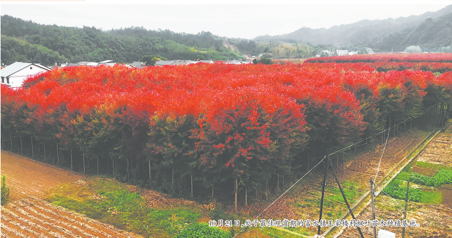
10月21日，处于最佳观赏期的富水镇王家楼村枫叶苗木种植基地。