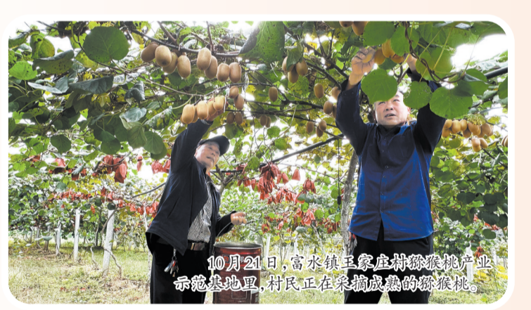
10月21日，富水镇王家楼村猕猴桃产业示范基地里，村民正在采摘成熟的猕猴桃。