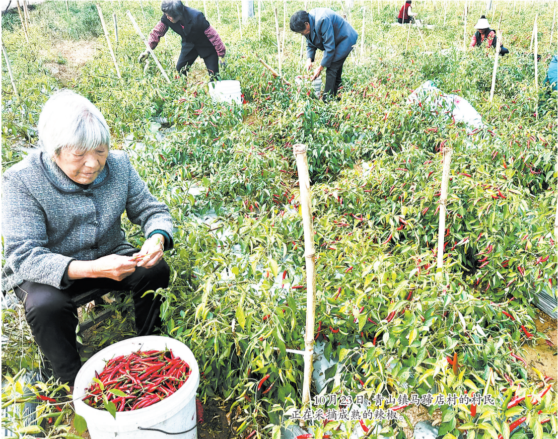
10月23日，青山镇马蹄店村的村民正在采摘成熟的辣椒。