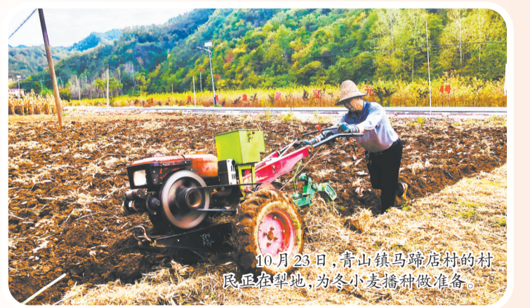
10月23日，青山镇马蹄店村的村民正在犁地，为冬小麦播种做准备。