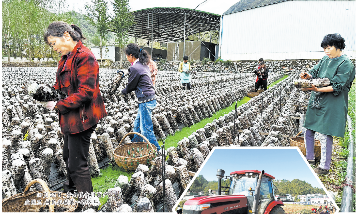
10月23日，青山镇合用葡萄产业园里，村民采摘第一茬冬果。