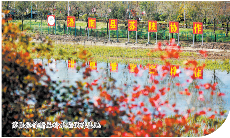
苏陕协作新品种水稻试种基地