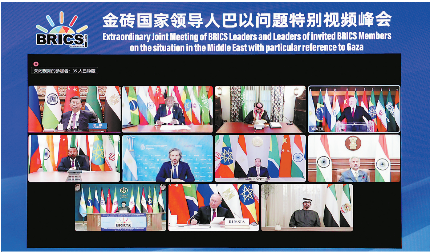
11月21日晚，国家主席习近平出席金砖国家领导人巴以问题特别视频峰会并发表题为《推动停火止战 实现持久和平安全》的重要讲话。

新华社北京11月21日电 11月21日晚，国家主席习近平出席金砖国家领导人巴以问题特别视频峰会并发表题为《推动停火止战 实现持久和平安全》的重要讲话。 习近平指出，本次峰会是金砖扩员后的首场领导人会晤。当前形势下，金砖国家就巴以问题发出正义之声、和平之声，非常及时、非常必要。加沙地区的冲突已持续一个多月，造成大量平民伤亡和人道主义灾难，并出现扩大外溢趋势，中方深表关切。当务之急，一是冲突各方要立即停火止战，停止一切针对平民的暴力和袭击，释放被扣押平民，避免更为严重的生灵涂炭。二是要保障人道主义救援通道安全畅通，向加沙民众提供更多人道主义援助，