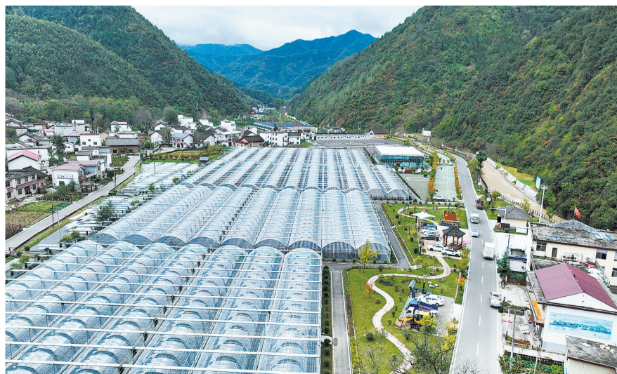
金米村全景。目前，金米村已拥有170座木耳大棚，种植规模达到500万袋。