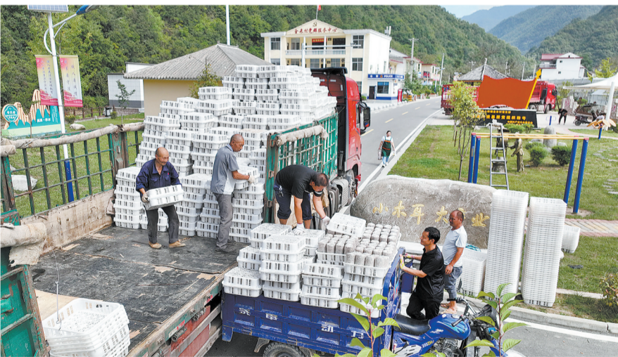
金米村村民在搬运木耳菌包，保障种植户供给。