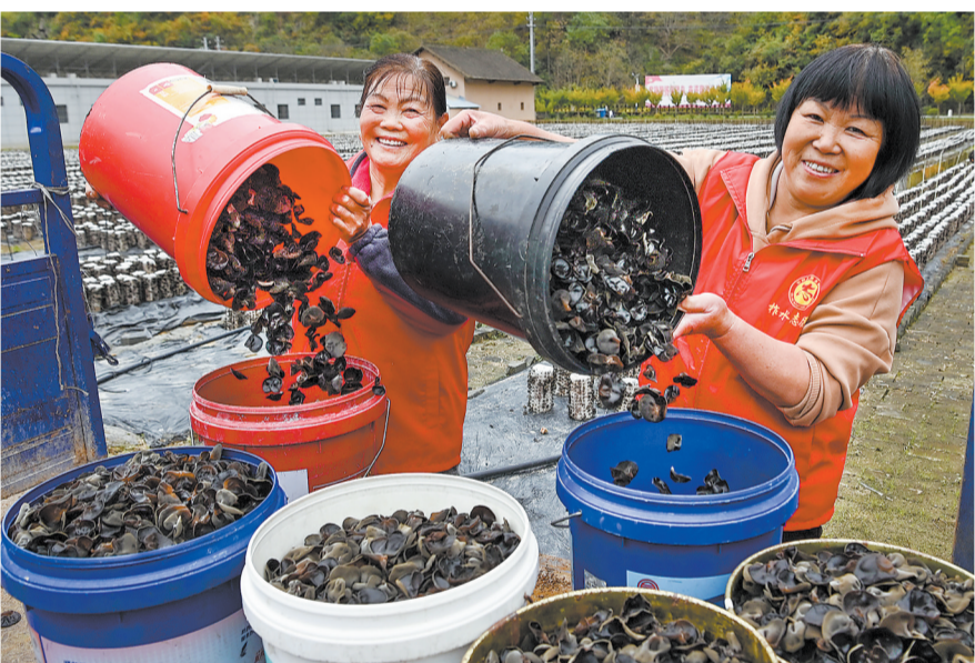
金米村村民在采收木耳，加工后供应市场。

小木耳已长成大产业。金米村迎着新时代的春风接续奋斗，村民信心满满行走在乡村振兴的道路上，日子越来越红火。