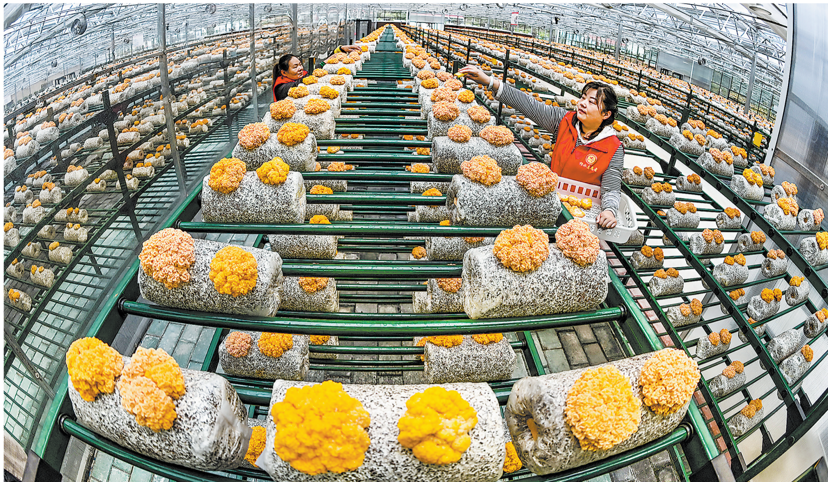
◁金米村村民在金米智慧农业产业园采摘金木耳。今年开始种植的金木耳，第一茬10万袋、秋季6万袋。