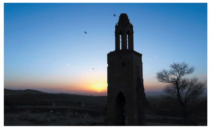
△大单巴(即八台子圣母堂)位于大同市左源县摩天岭风景区，建于清光绪二年(1876年)，属哥特式建筑风格。1900年庚子之乱被毁。现存教堂塔楼，宽4.5米，进深3.6米，高约20米，与澳门大三巴遥相呼应，上嵌各式砖雕图案，正面细部特征极为精美。大单巴是中国天主教的7处圣地之一。梵蒂冈为其建档。