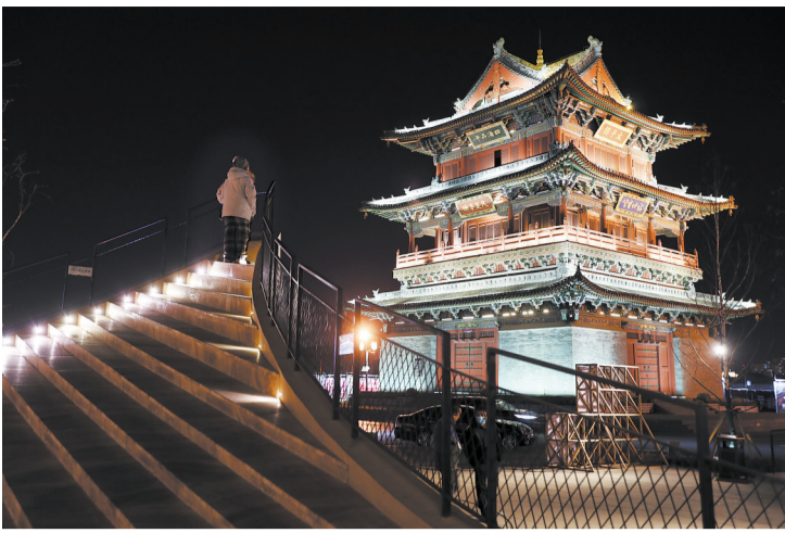
△大同太平楼位于大同古城以东和阳街与太平街交会中心，与城北魁星楼、城南鼓楼、城西钟楼相应。

▽大同北魏明堂是中国历史上的四大明堂之一，是北魏帝王举行朝会、祭祀、庆赏等大典的地方，是礼治文化的载体，是唯一在原址修复完成的明堂，是平城遗址的城内标志。