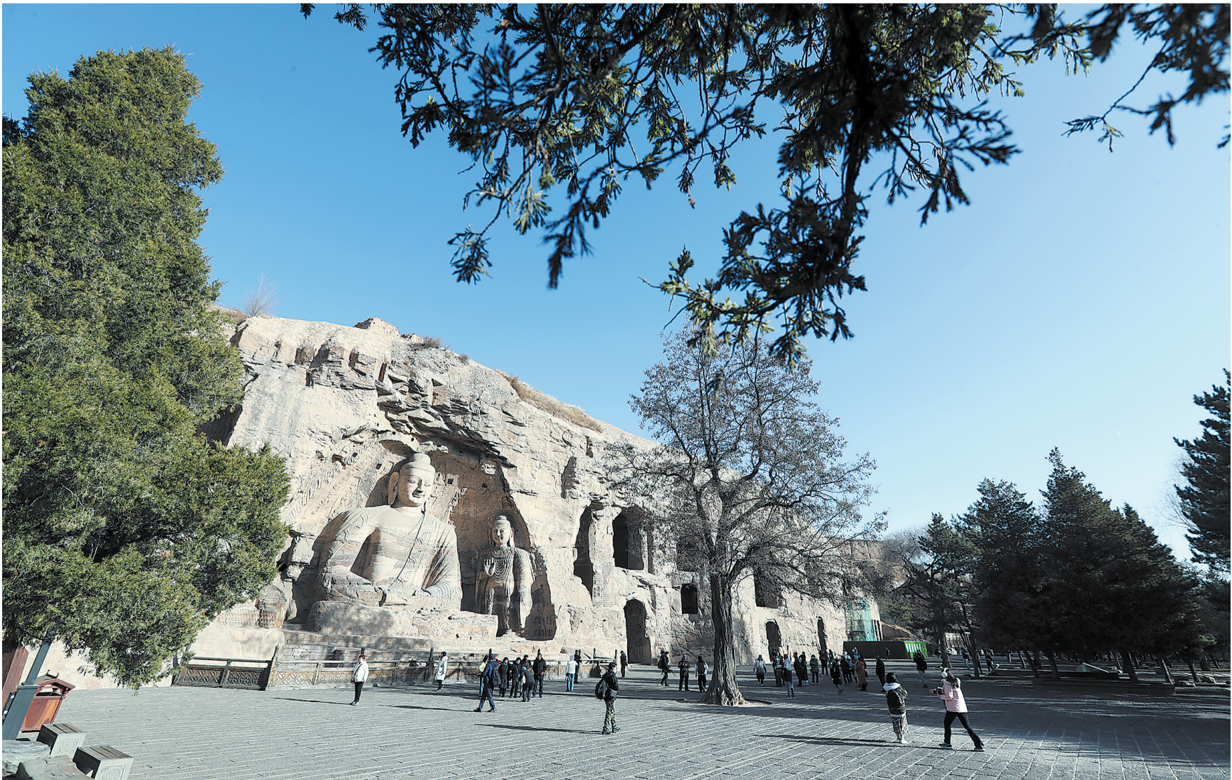
△云冈石窟是中国著名的石窟群之一，开凿始于北魏时期，2001年被联合国教科文组织列入世界文化遗产。