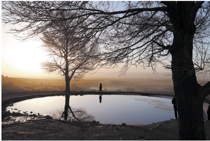
△一游客迎着朝阳走过圣泉