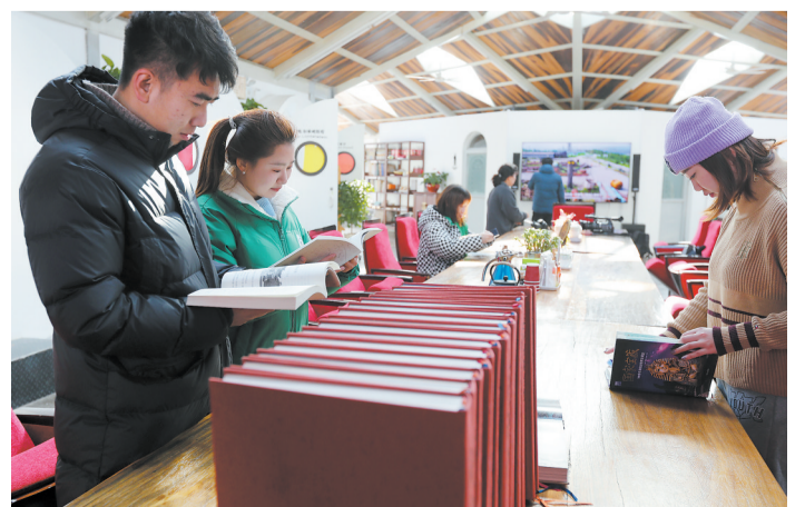
△用废旧水泥管、废旧钢铁等材料打造出来的绿色环保建筑——云冈石窟“蜗牛公寓”一角。