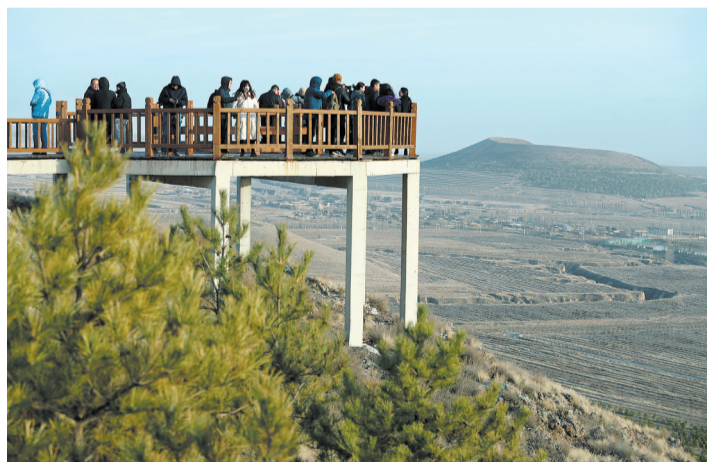
△大同火山群国家地质公园观景台