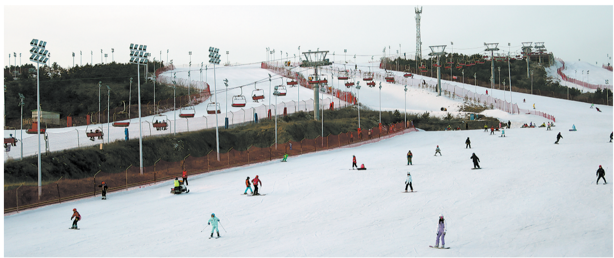
△大同万龙白登山滑雪场最高海拔约1240米，垂直落差125米，是以初级、中级滑雪娱乐为主，高级滑雪为支撑的运动滑雪度假胜地。

说到大同的变化，市民讲述最多的是2008年以来，大同市委、市政府对城市和煤矿环境的大力治理，对以大同古城为重点的老城区修复开发和新城科学规划，从而使一座“煤城”变成了亮丽的古城。因此，大同市被授予国家重点旅游城市、国家园林城市、国家新能源示范城市、中国优秀旅游城市、中国十佳运动休闲城市等称号，同时因其拥有独特的美食还被评为“中国刀削面之乡”、国际美食之都。