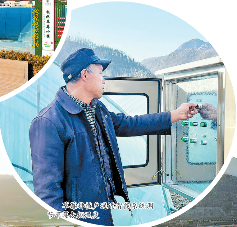
草莓种植户通过智能系统调节草莓大棚温度