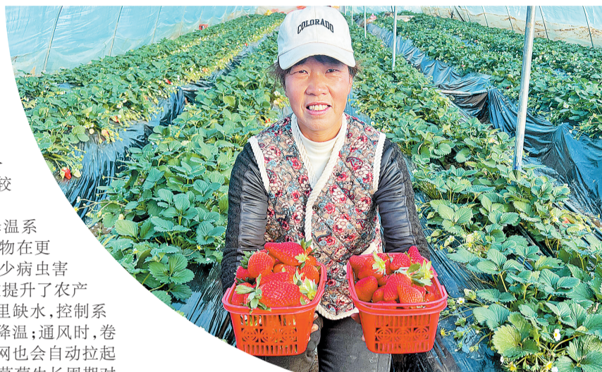
草莓丰收，给周边村民带来了可观的收入。