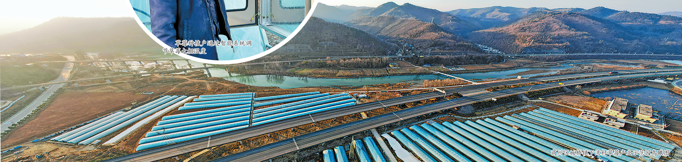
商州区板桥镇下湾村草莓产业示范园鸟瞰图