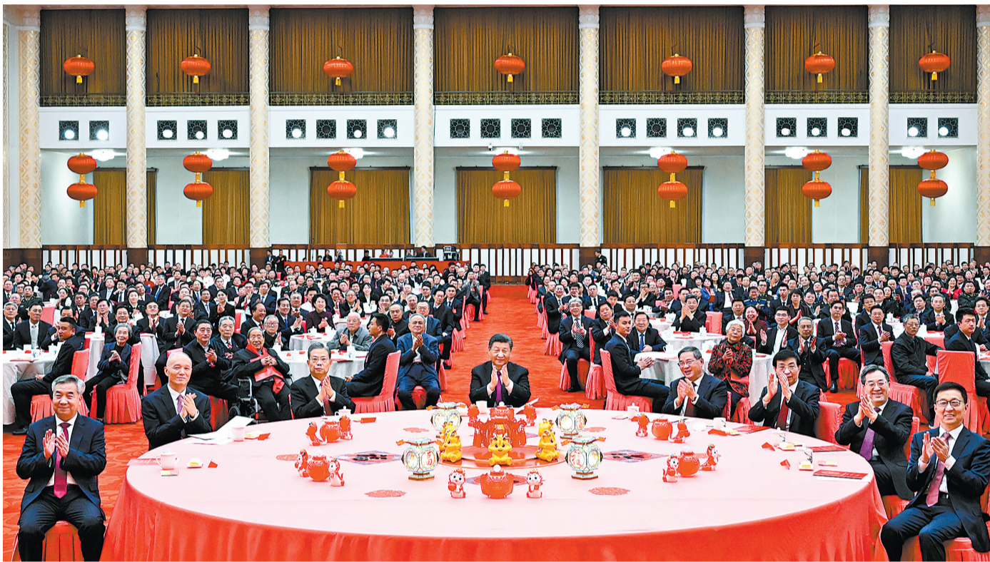
2月8日,中共中央、国务院在北京人民大会堂举行2024年春节团拜会。党和国家领导人习近平、李强、赵乐际、王沪宁、蔡奇、丁薛祥、李希、韩正等同首都各界人士齐聚一堂,共迎新春。

新华社北京2月8日电 中共中央、国务院8日上午在人民大会堂举行2024年春节团拜会。中共中央总书记、国家主席、中央军委主席习近平发表讲话,代表党中央和国务院,向全国各族人民,向香港特别行政区同胞、澳门特别行政区同胞、台湾同胞和海外侨胞拜年。