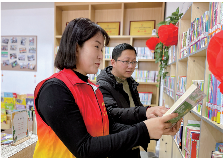
3月6日，商洛市图书馆名人街社区书屋的社区志愿者正在为前来看书的市民介绍图书分类。据了解，名人街社区书屋包含少儿绘本、少儿图书、成人图书和期刊共计3000多册，不但为社区居民提供了读书场所，也培养了市民的阅读兴趣。