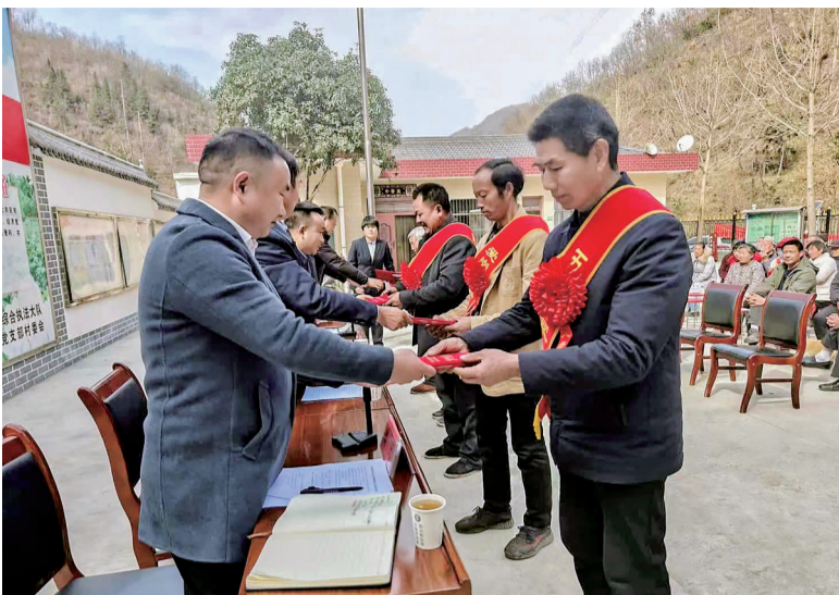
3月11日，镇安县庙沟镇五四村召开2024年群众大会，镇村干部组织学习了中央一号文件，对“好媳妇”“好公婆”“五好家庭”、致富能手进行了表彰奖励，用身边典型在村里掀起倡导真善美、争做致富带头人的热潮。

20多年间，她辛勤耕耘，献身幼教事业，收获累累硕果。她就是洛南县寺耳镇黄龛村的黄爱玲。