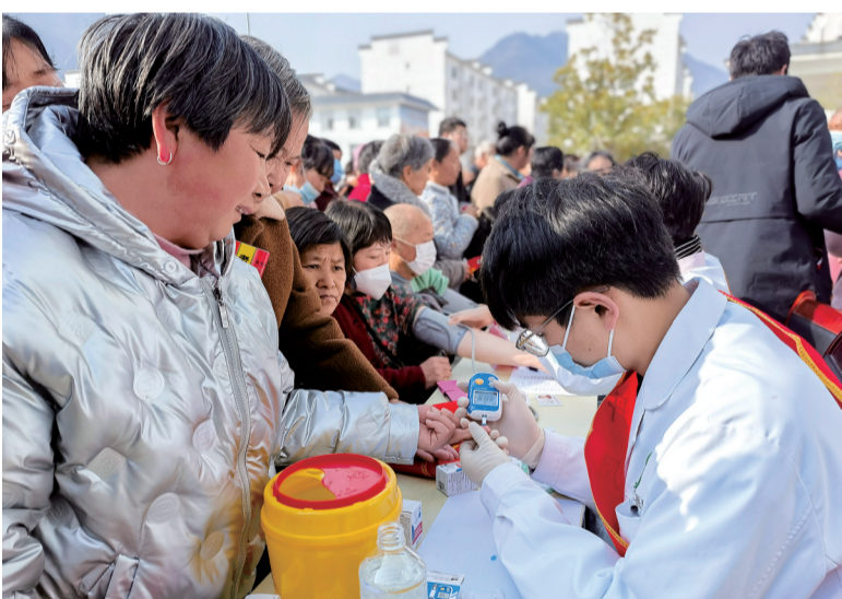
3月14日，丹凤县竹林关镇联合西京医院及丹凤县第二医院开展“送医送一线、义诊暖人心”便民义诊服务活动。活动中，医疗团队为群众进行常见病、多发病、慢性病、疑难杂症等疾病的健康普查、诊断及用药指导等服务。

群众无小事，枝叶总关情。通过此次走访慰问活动，把党和政府的温暖送到了群众的心坎上。下一步，小岭镇党委、政府将继续把弱势群体解决实际困难当作头等大事来做，关注弱势群体，聚焦“小切口”，办好“微实事”，将基层工作做到群众心坎上，走出真情，访出实效。