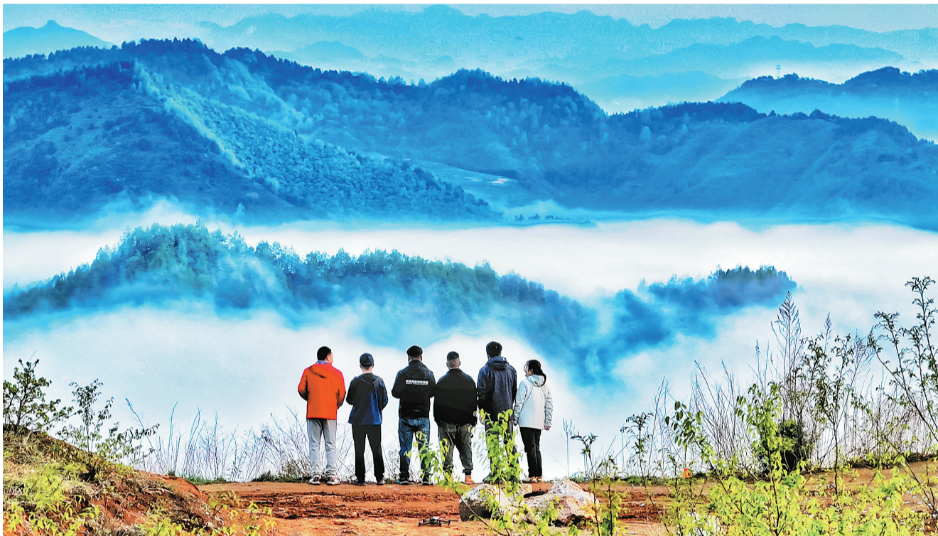
4月，随着气温回暖，我市多个景区进入了最佳云海观景季。近年来，我市全面推进“康养+”多业深度融合，聚力打造中国康养之都，吸引各地游客前来游玩赏景。图为4月14日，游客在商州区戴云山欣赏云海美景。