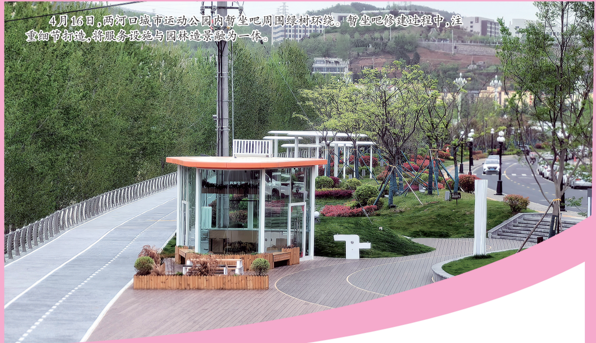
4月16日,两河口城市运动公园内暂坐吧周围绿树环绕。暂坐吧修建过程中,注重细节打造,将服务设施与园林造景融为一体。