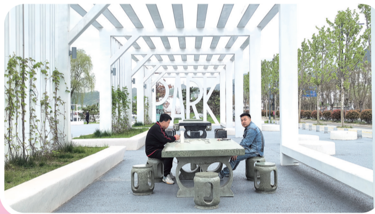
4月16日,南秦河生态公园暂坐吧周围环境清幽、草坪如带环绕,令人心旷神怡,两位市民在暂坐吧内相对而坐、交谈甚欢。