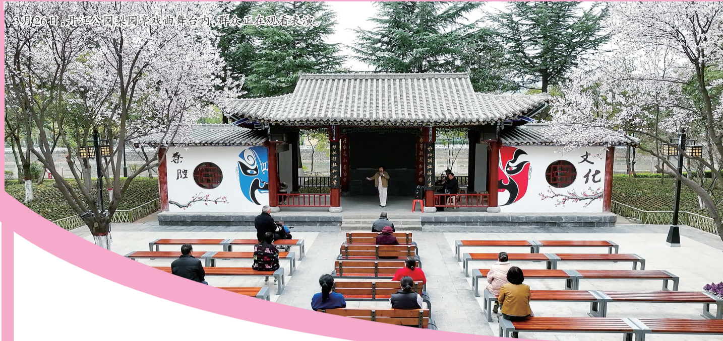
3月26日,丹江公园梨园亭戏曲舞台内,群众正在观看表演。