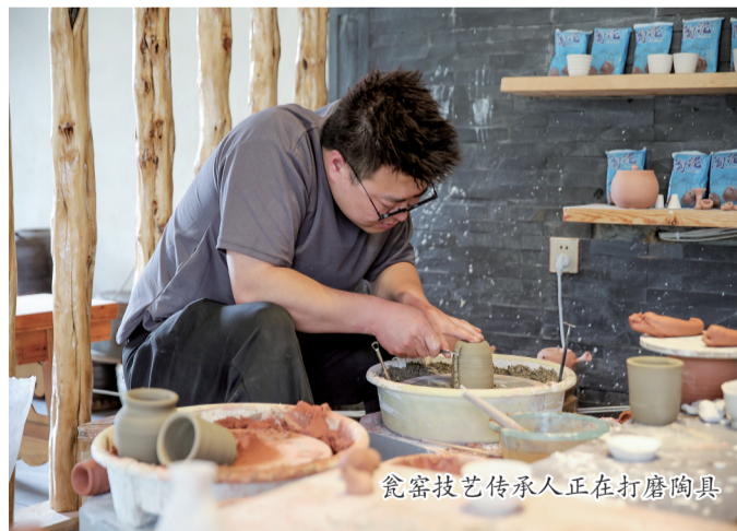
瓷窑技艺传承人正在打磨陶具

峪里轮蹄去又来。”一首《咏龙驹寨》真实反映了清代时期龙驹寨资峪沟商贾往来的繁荣景象。如今，资峪沟村深度挖掘商贾古道上的三里棧和独特的瓷窑文化，文化赋能，打造精品民宿，发展乡村旅游，促进农文旅深度融合。