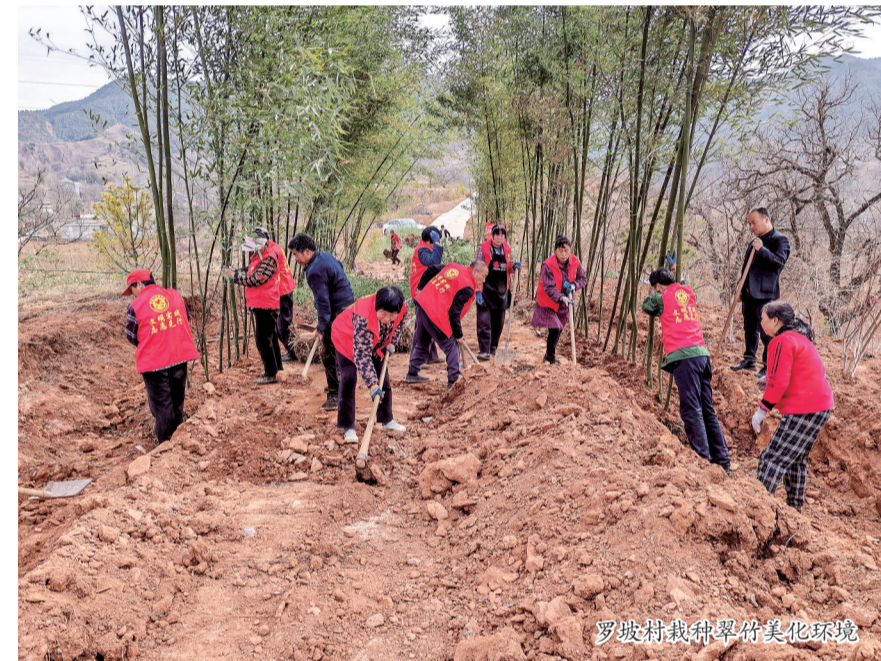
罗坡村栽种梨树美化环境

文化兴则乡村兴。建设宜居宜业和美乡村，既要“塑形”也要“铸魂”。在推进乡村治理中，移风易俗是引领乡风文明新风尚的“重头戏”。