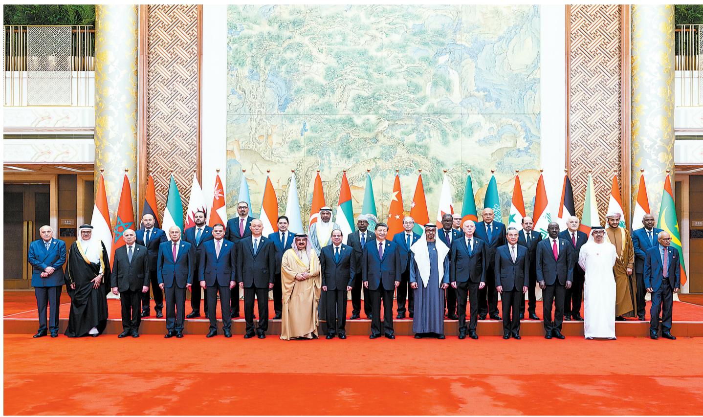
5月30日上午，国家主席习近平在北京钓鱼台国宾馆出席中阿合作论坛第十届部长级会议开幕式并发表主旨讲话。这是习近平同巴林国王哈马德、埃及总统塞西、突尼斯总统赛义德、阿联酋总统穆罕默德、阿盟秘书长盖特以及22位阿拉伯国家代表团长集体合影。