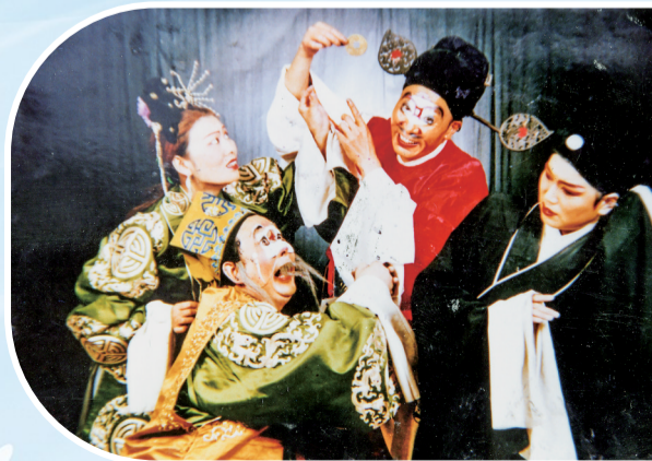
商洛道情《一文钱》剧照

商洛道情戏，经过几代戏曲音乐工作者半个多世纪的不懈挖掘传承，在现代音乐理论提升下，道情戏既具原生态品质，又含时代韵味，虽属地方小戏，却有无限魅力。“我们要保护好这张名片，做到非遗有传承，传统有坚守，使我们商洛地方戏剧事业不断发展向前。”张平说。