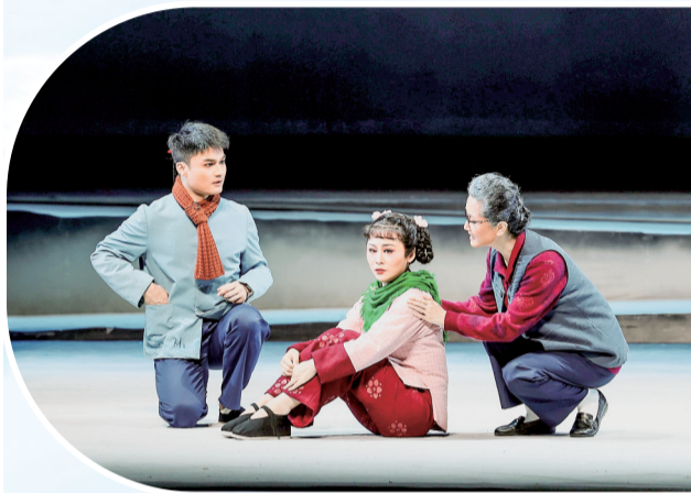
商洛花鼓《若河》剧照

“沉寂的山庄在变化，笑声朗朗哈哈，站在村口四下看，细看一户又一家……”5月29日，市地方戏曲研究院排练大厅内，演员们正在为“商洛周周有戏看”文化惠民演出进行紧张排练。