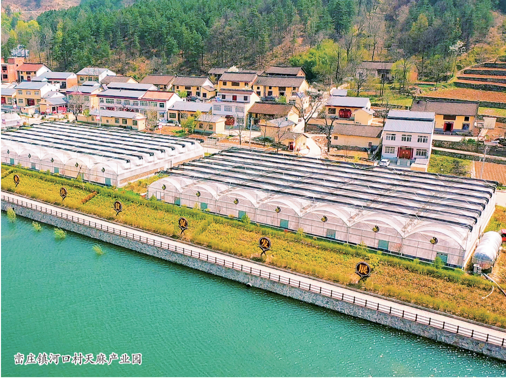
商庄镇河口村天麻产业园