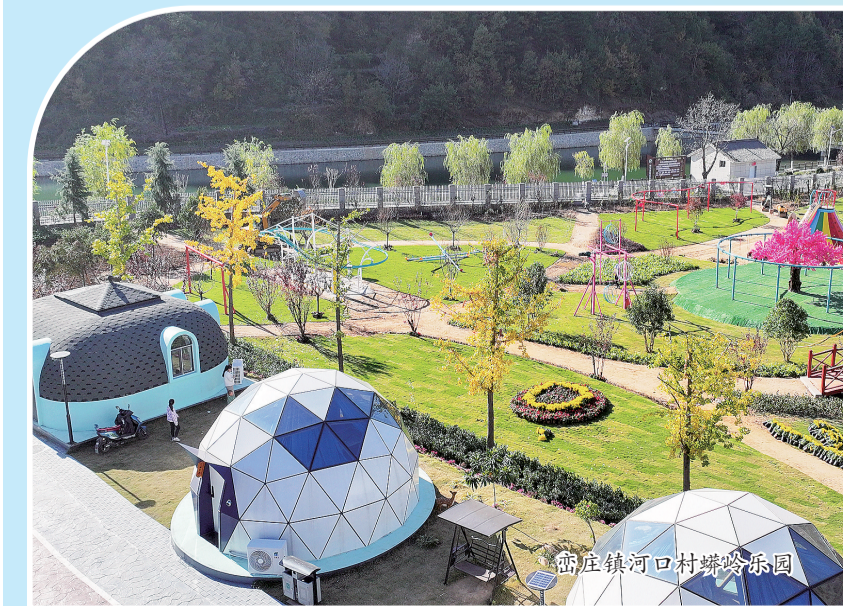
商庄镇河口村塔岭乐园