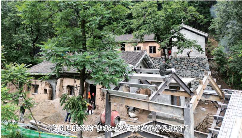
商州区张峪沟“归旅·秦岭深处”野奢民宿项目

滴水穿石，关键在于瞄准一个方向；铁杵成针，必须用对一种劲头。面对新的发展机遇，商州区将全力加快民宿项目建设进度，力争年底全部建成运营。同时，将康养民宿发展纳入全区旅游发展总体规划，推进康养民宿与“医养游体药食”六大康养产业融合发展，全面提升农村配套设施和人居环境建设，培养一批懂经营、善规划的专业人才队伍，以点带面推动全区民宿产业快速发展，让民宿经济“遍地开花”，为乡村振兴蓄势赋能。