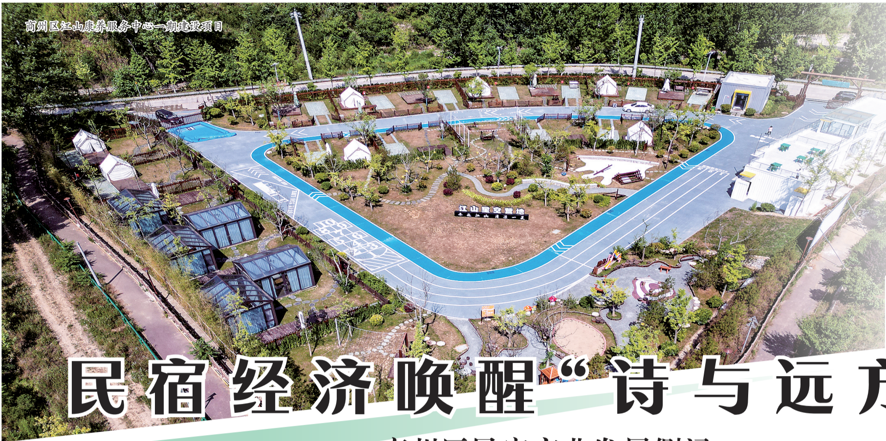
商州区江山康养服务中心一期建设项目