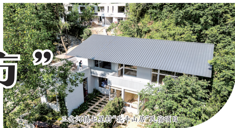
三岔河镇七星村“北斗山居”民宿项目