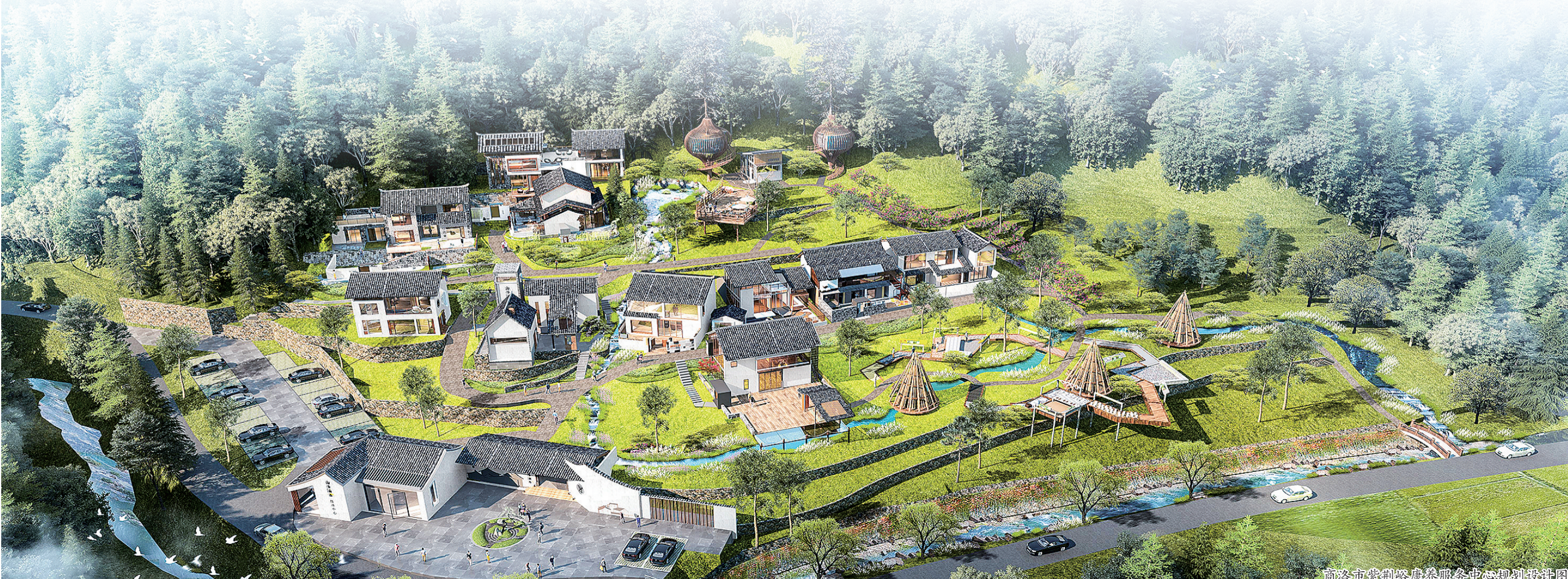
商洛市紫阳康养服务中心规划设计图

依托张峪沟优美的生态环境和便捷的区位优势，商州区对原有闲置宅基地进行盘活，规划“林间秦岭”高端民宿、“良栖山语”合家民宿、“峪见童年”亲子民宿、“秦岭深处”野