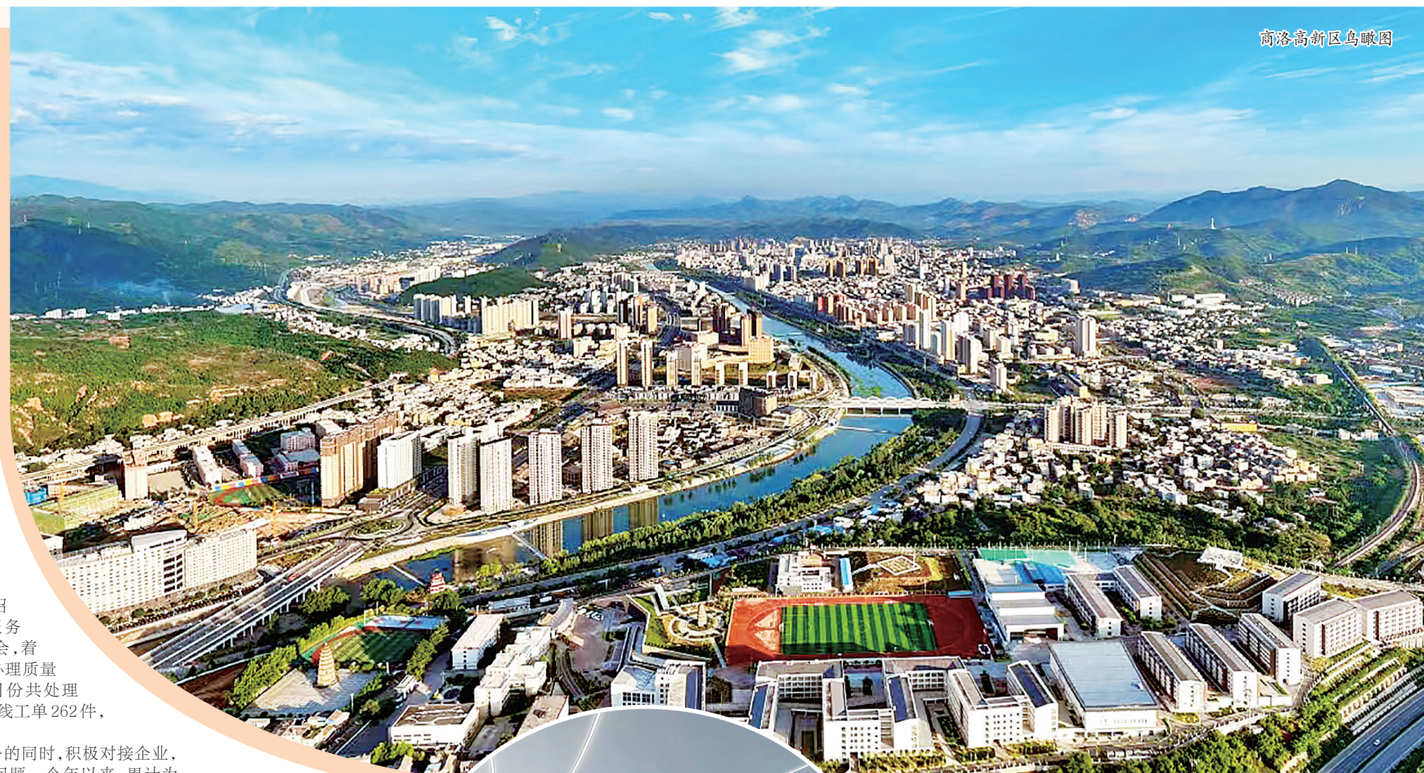
商洛高新区鸟瞰图

征程万里阔,奋楫正当时。下一步,商洛高新区将聚焦“十四五”长远发展和“西商融合”“两区融合”发展机遇,继续以奋斗姿态面对挑战,聚焦产业发展的主责主业,以高质量项目强支撑,以营商环境强基础,以作风能力项目强保障,全力为优质项目落地做好服务保障,奏响高质量发展的最强音,为奋力建设“一都四区”贡献力量。