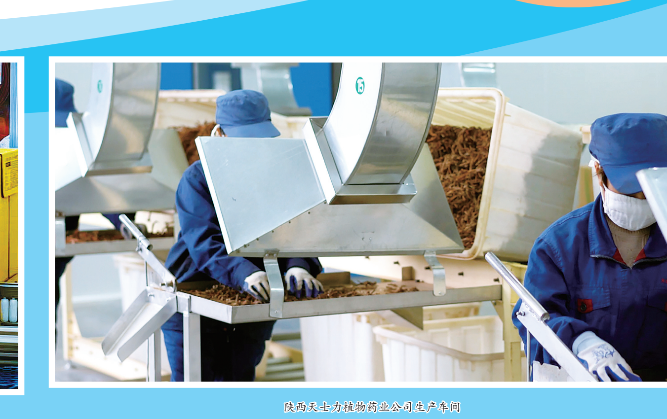
陕西天士力植物药业公司生产车间