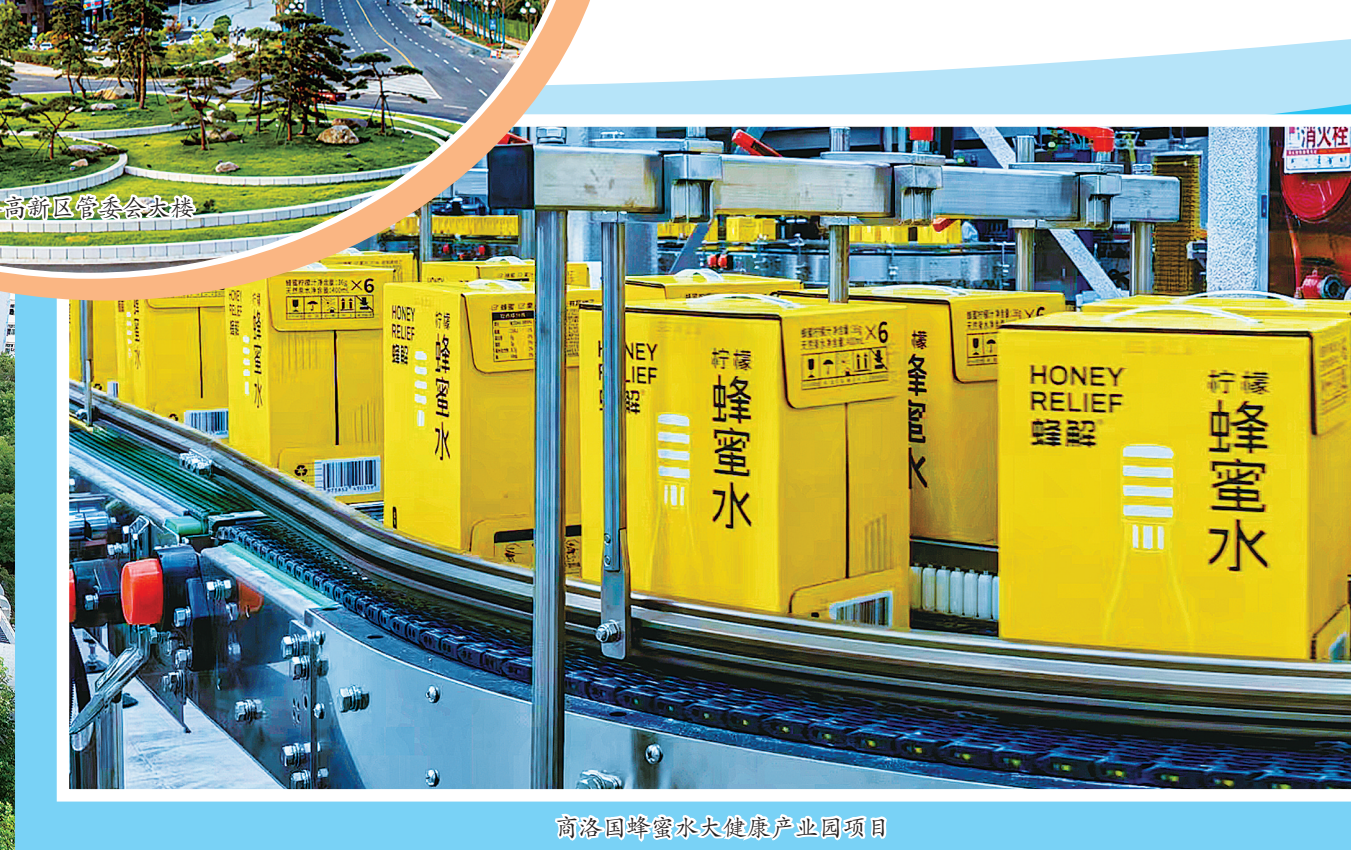
商洛国峰蜜水大健康产业园项目