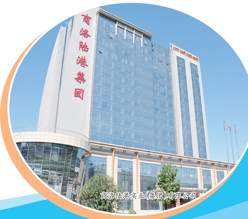
商洛比亚迪(集团)有限公司