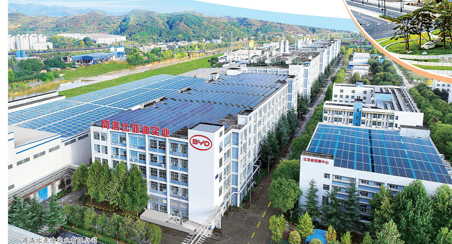
商洛比亚迪实业有限公司