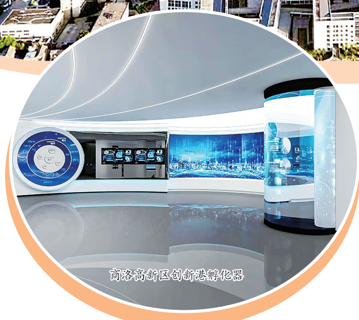
商洛高新区融媒体中心