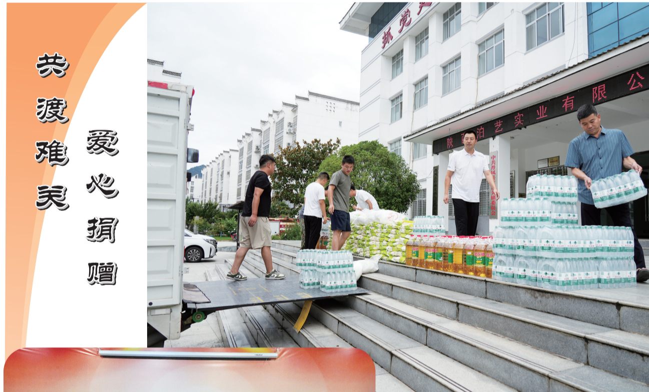
共渡难关 爱心捐赠

竹林关镇18个村（社区）严格落实防溺水巡查值守制度，按照网格化管理分工，建立重点人群包抓责任制，组建防溺水巡逻队伍，确保重点水域、重点时段看管“两个全覆盖”，形成巡查工作台账，加强对危险区域的巡逻防控，及时发现、制止并劝离游玩人员；对河道周围配备的警示牌及救生圈、救生衣、救生绳、竹竿等救生设施进行定期检查，确保每片水域有人看、有人巡、有人管、有人防。坚持线上线相结合，广泛宣传教育，充分发挥村（社区）“两委”成员、网格员、党员干部、志愿者等群体作用，利用微信群、村广播以及进村入户派发宣传单等方式，为群众讲解防溺水安全和溺水急救知识，严防意外事故的发生。开展防溺水安全知识宣讲，通过悬挂防溺水宣传条幅、设置防溺水公示牌及警示牌、发放防溺水安全告知书、张贴防溺水宣传标语等方式，营造防溺水的良好氛围，让防溺水知识入脑入心，切实绷紧防溺水安全“思想弦”。