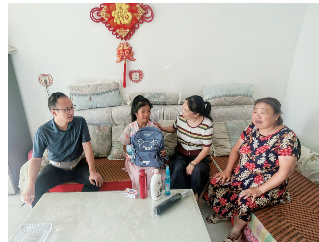
为进一步做好困境儿童的汛期安全和保障监护工作，近日，丹凤县民政局对全县孤儿及事实无人抚养儿童开展全面走访慰问活动，为27名困境儿童发放了书包、雨伞、水杯、洗发水等生活物品。

活动现场，工作人员为妇女群众发放《民法典进家庭普法宣传册》《“八五”普法农村法律常识必读》《农村常用实用法律知识手册》等宣传资料3000份。同时，工作人员用通俗易懂的语言给她们讲解法律手册内容，使广大妇女群众树立正确的维权观念，懂得运用法律武器维护自己的合法权益。司法所工作人员结合辖区实际情况，通过发生在群众身边的生动案例，以案释法，以法论事，深入浅出地给辖区妇女开展有针对性的普法宣传，为她们详细解读《陕西省反家庭暴力条例》《妇女权益保障法》基本内容及重要意义，引导和帮助群众认识家庭暴力的危害。