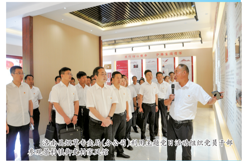
洛南县烟草专卖局(分公司)利用主题党日组织党员干部参观景村镇御史村农家民宿