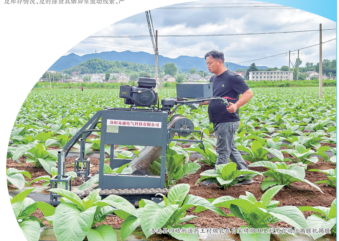
洛南县四皓街道药王村烟农在自家烤烟田里利用自动化揭膜机揭膜