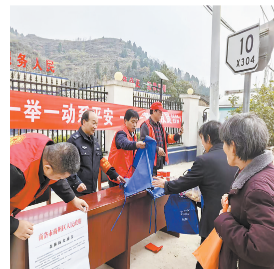
11月8日，商州区金陵寺镇向群众宣讲交通安全、森林防火、平安建设等法律法规，并发放宣传资料100多册。

据了解，市慈善协会共接收捐赠药品100箱、总价值44.36万元，分别分配给商州区20箱、洛南县15箱、山阳县15箱、丹凤县10箱、商南县10箱、镇安县10箱、柞水县10箱、市协会10箱，这些药品由广药陕西医药有限公司负责免费配送给各县区。此次捐赠药品不得对外销售，只能发给一线困难职工和基层困难群众。各县区慈善协会协同民政、卫健、城管、市监等部门及镇政府将捐赠药品发放给困难群众，整个药品捐赠发放工作于11月底前完成。