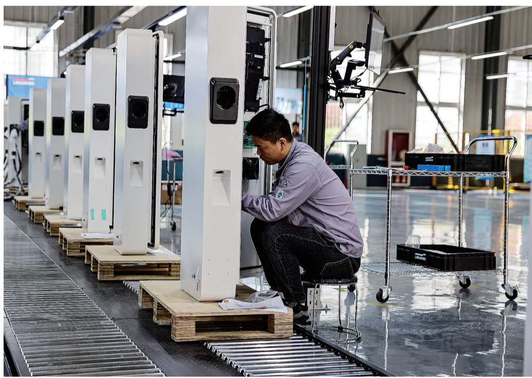
4月1日,工人在商洛高新区商洛领充数字新能源科技有限公司生产基地组装充电桩产品。该项目于2025年5月开工建设,10月建成试产,全部达产后可实现年产交流充电桩80万台,产值2亿元,带动就业100多人。

活动期间,台湾网红还将开启专场直播带货,推广商南茶叶和丹凤葡萄酒两个商洛特色农产品,借助新媒体流量让秦岭好物走出大山。两岸媒体人边走边看、边访边谈,通过直播、短视频、文字报道等形式,实时分享商洛乡村振兴的鲜活故事,搭建起两岸民众了解交流的桥梁。“我们将把此次商洛行的所见所感带回台湾,让更多台湾民众看到秦岭山区的发展新貌,推动两岸在乡村振兴领域的交流合作走深走实。”台湾媒体记者纷纷表示。